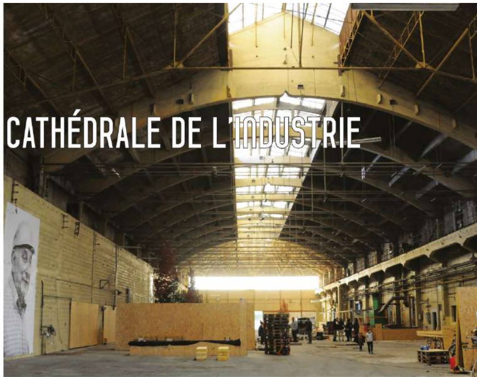
Sous la nef de l'usine Rubanox, la Maison d'architecture de la Savoie a tout mis en œuvre pour recevoir le grand public auquel seront proposées de nombreuses animations.

Une exposition, montée pour l'occasion, retrace l'histoire du lieu à travers une série de plans, photographie et textes récoltés auprès de l'IHA (institut pour l'histoire de l'aluminium). En parte-