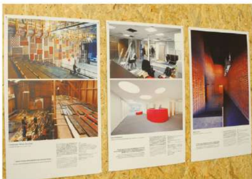
Des expositions qui permettront de découvrir notamment des reconversions de friches industrielles.

« L'esprit des friches », de Claude-Pierre Chavanon (2006). La réhabilitation des friches industrielles à travers un voyage insolite en Europe, une découverte de la valeur d'usines devenues inutiles, de la qualité architecturale et esthétique de sites réputés grisés et tristes, grâce aux passeurs que sont les architectes passionnés par la reconversion.