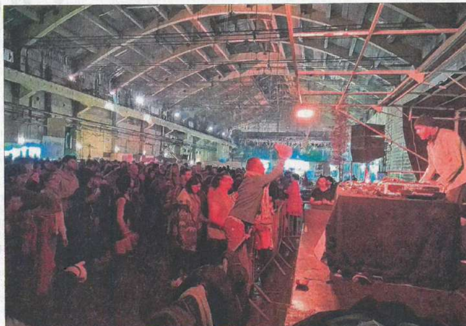
Moment de fête détonnant, vendredi, au cœur des 4000m 2 de l'ancienne usine Rubanox avec un bal populaire et les sons électro "made in" Ellebore.