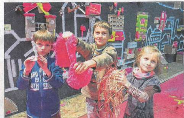
Les enfants n'ont pas été oubliés, à travers des ateliers et une fresque murale, ils ont pu dessiner leur ville de demain.