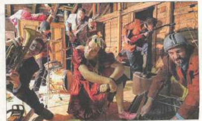
L'architecture en mode ludique, accessible à tous et festive, c'est aujourd'hui et demain sur le site de Rubanox. Ce soir, le groupe "À bout de fiches" proposera un bal populaire.