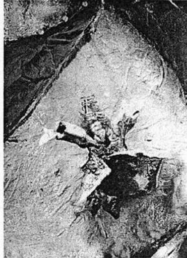
Le monde entier est un théâtre, dit le programme, shakespeareien